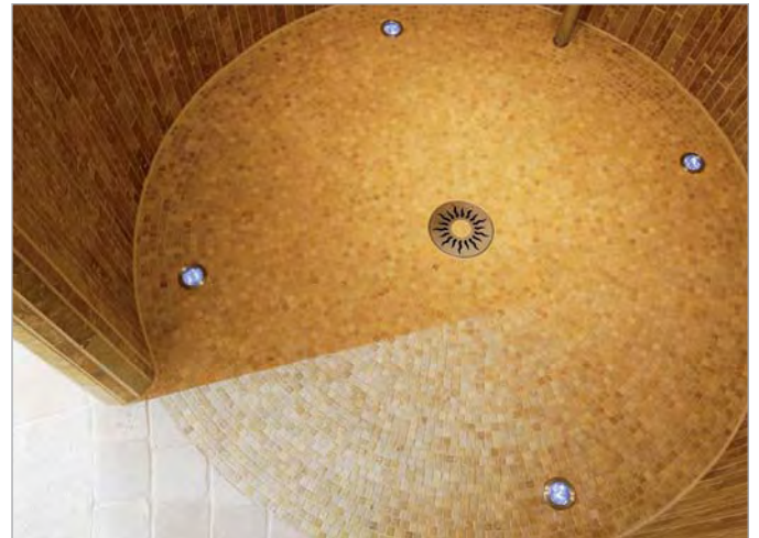
■ In das Hartschaum-Duschtassenelement der Runddusche TUB-RD wurden vier Beleuchtungskörper integriert. Die Körperform wurde paßgenau ausgeschnitten und die Lichtelemente zwischen Unterbauelement und Hartschaum-Duschtassenelement montiert.

Die Flexibilität der Hartschaum-Trägerelemente ist Garant für eine fast unbegrenzte Gestaltungsfreiheit.