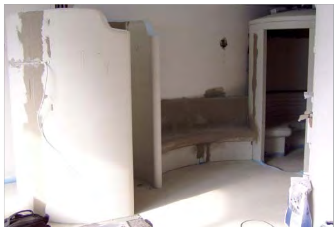
■ Ansicht während der Verarbeitung.

Das Basismaterial bildet die Grundlage für die patentierte Baufel LUX ELEMENTS®-ELEMENT, die beidseitig mit einer mit Glasfasergewebe armierten Mörtelschicht versehen ist. Sie ist in elf Dicken