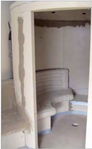
■ Detailansicht Sitzbank: Geschwungene Formen sind mit den feuchtigkeitsresistenten Hartschaum-Trägerelementen problemlos ausführbar.

Individuelle Formgebungen lassen sich durch Maßanfertigungen für jede Raumgröße realisieren. Unter der Bezeichnung CONCEPT führt LUX ELEMENTS eine eigene Produktlinie für Sonderanfertigungen und geschwungene Formen.