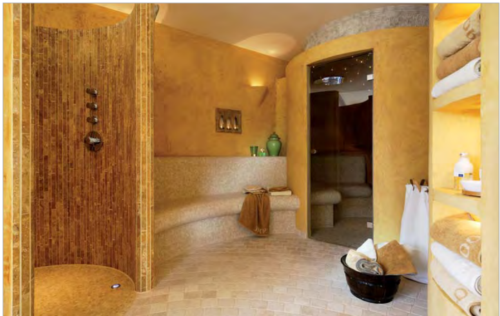
■ Die private Wellness-Oase nach der Fertigstellung: Runddusche, Ruheinsel und Dampfbad wurden individuell mit Hartschaum-Trägerelementen von LUX ELEMENTS ausgeführt.

Ganze in Kombination mit komfortablen Liegeflächen und Sitzbänken, offenem Kamin, versenkbaren Fenstern und einem versteckten Spiegelfernseher. Edle Stoffe und bequeme Kissen sorgen für eine wohliche Atmosphäre.