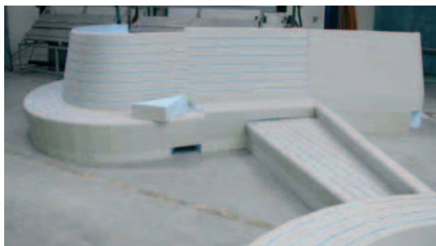
Alle hardschuim draagelementen werden in de fabriek van Lux Elements precies op maat vorgefabriceerd, in de eigen productiehallen opgebouwd en op nauwkeurigheid gecontroleerd.