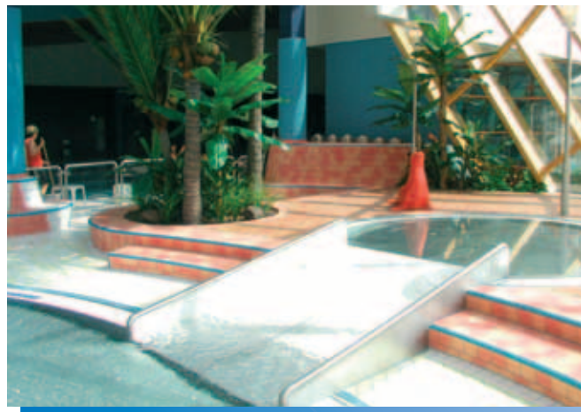
Er werden twee plonsbaden op verschillende niveaus bijgebouwd die met een glijsbaan met elkaar verbonden zijn.