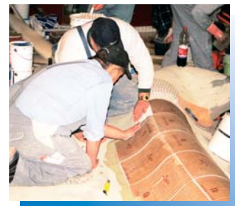
De vormgeving van de rondingen op de bodem vereist moeilijk te realiseren detailwerk.