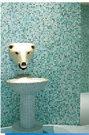
Detail ijsbronnen: De betegeling gebeurde direct op de ronde wandelementen die door Lux Elements waren geprefabriceerd.

De oprichting van het vijvercomplex in de Kurfürsten Galerie vormde een highlight. Hier werden bijzondere eisen gesteld zowel wat betreft de snijtechniek als aan de transfer van knowhow tussen de uitvoerders. De ellipsvormige vijver die in het centrum van het complex werd gebouwd, bezit een torusvormige omranding die in haar komvormige uitwerking exact werd uitgewerkt volgens de maten op de tekening van