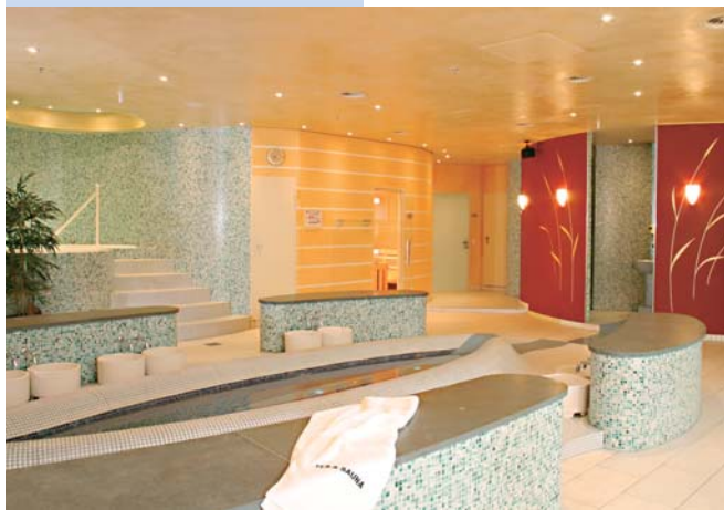
Het wellness-resort in Kassel na voltooiing. Alle gebogen vormen werden met dragende hardschuimelementen van Lux Elements uitgevoerd.

zorgde de detailgetrouwe planmatige ondersteuning uit Leverkusen ervoor dat de werklui alle tijdlimieten konden halen. Hoewel de uitvoering en planning plaatsvond in de hectische periode voor Kerstmis, werd het project tijdig afgesloten en het tijdsmanagement van de