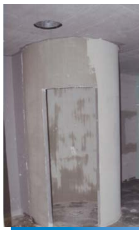
De ronde douche klaar voor betegeling werd uit dragende hardschuimelementen van de productlijn LUX ELEMENTS®-TUB vervaardigd.