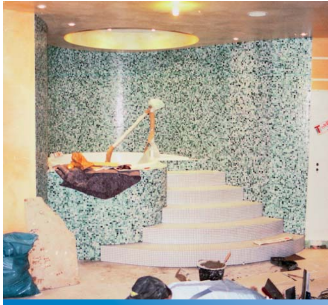
Dompelbad in de constructie met ronde wand voor het aanbrengen van de treden en voor de betegeling. Het dompelbad na voltooiing.