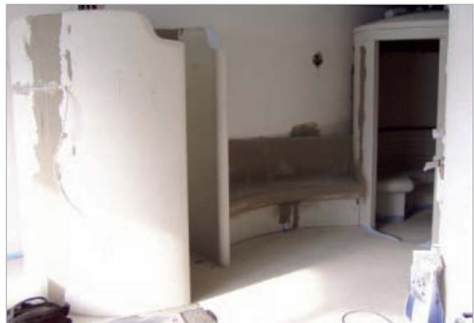
■ Aanzicht tijdens de verwerking.

LUX ELEMENTS produceert polystyreen hardschuim van eigen fabrikaat en is gespecialiseerd in de verdere verwerking tot producten voor de sanitaire, bouw- en wellnessmarkt. Het geëxpandeerde schuim (EPS) is ideaal voor de ondergrond in vochtige ruimtes, aangezien de vochtresistente polystyreenkern niet opzwellt door natheid en duurzaam vormstabiel is. Het basismateriaal vormt de grondslag voor het gepatenteerde bouwpaneel LUX ELEMENTS®-ELEMENT dat aan beide kanten is voorzien van een mortellaag gewapend met glasvezelweefsel. Het is leverbaar in elf dikten en twee