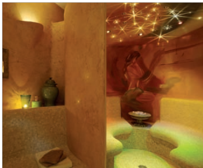
■ Pure ontspanning onder de sterrenhemel: In het ruimteconcept van de familie Dorner krijgen lichtelementen een essentiële vormgevingsfunctie.

van Dorner GmbH aan LUX ELEMENTS gevolgd.