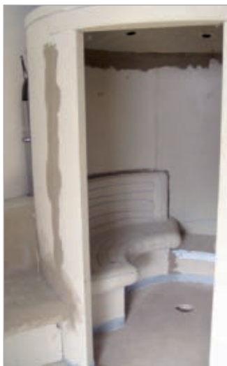
■ Detailaanzicht zitbank: Gebogen vormen kunnen probleemloos worden uitgevoerd met de vochtresistente dragende hard-schuimelementen.

ingezet en worden aangevuld door een grote variëteit aan geprefabriceerde systeem-bouwpakketten. Individuele vormgevingen kunnen voor elke grootte van ruimte worden gerealiseerd door maatwerk. Onder de benaming CONCEPT brengt LUX ELEMENTS een eigen productlijn voor speciale vervaardigingen en gebogen vormen.