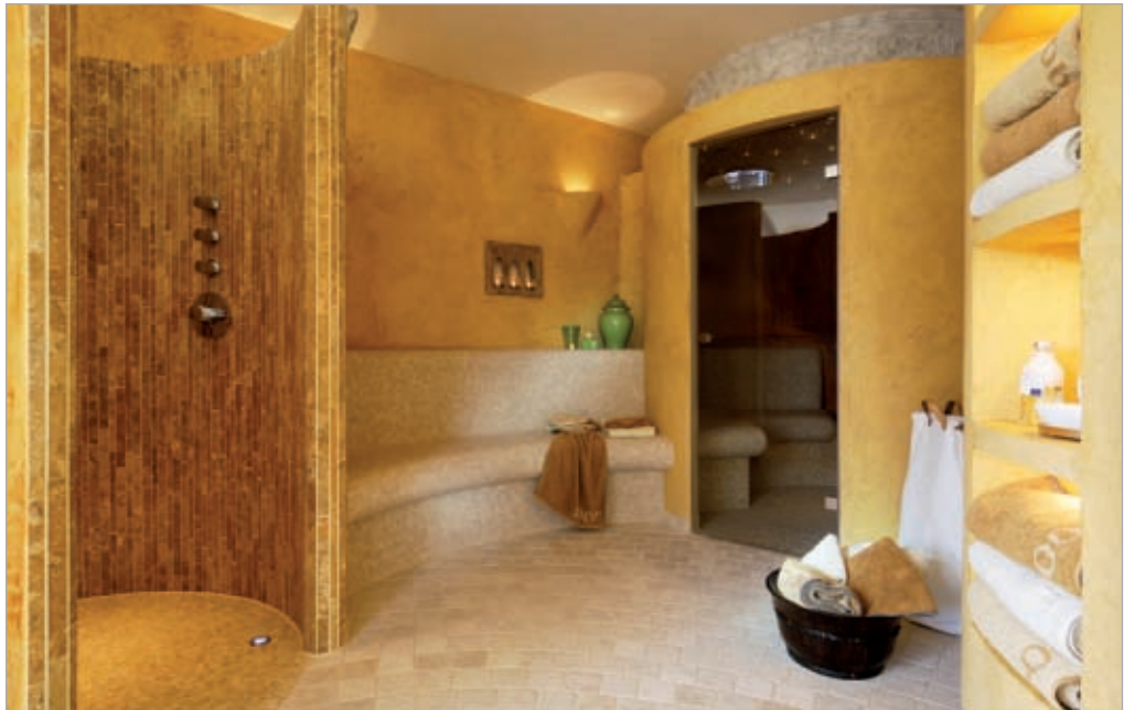
■ De privé wellnessoase na de oplevering: ronde douche, eilanden van rust en stoombad werden individueel uitgevoerd met dragende hardschuimelementen van LUX ELEMENTS.

gecombineerd met comfortabele ligvlakken en zitbanken, open haard, vensters die men kan laten zakken en een verborgen spiegeltelevisie. Edele stoffen en comfortabele kussens zorgen voor een behaaglijke atmosfeer.